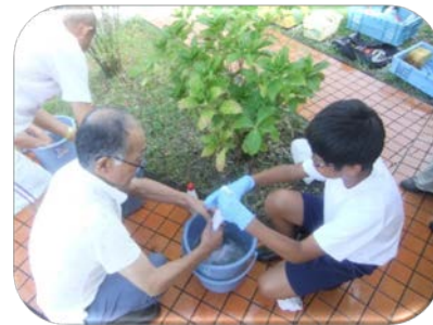
“美濃加茂掃除に学ぶ会”での様子