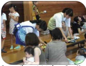
“ファミサポサロン山之上グラマ”での様子