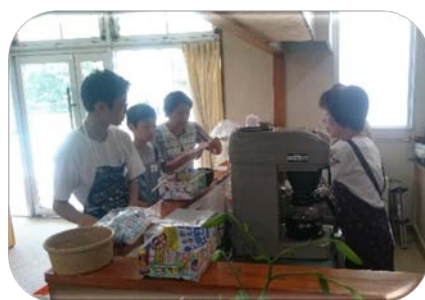
“わかくさ”での様子