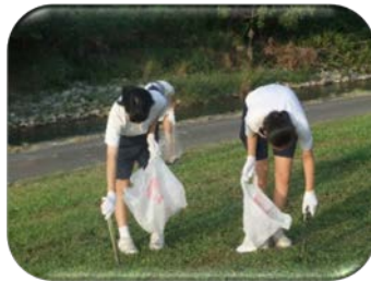
“美濃加茂善意銀行”での様子