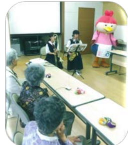
“ギターマンドリン音楽サークルひまわり”での様子