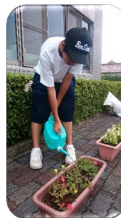
“みのかも花づくりの会”の様子