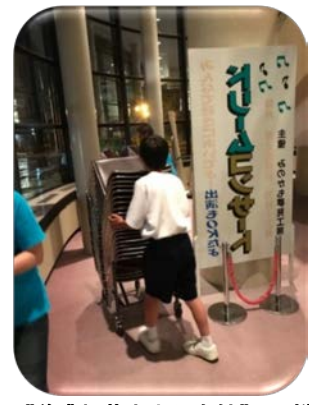
“美濃加茂市文化会館”での様子