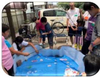
“NPO法人虹の里”での様子