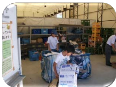
“みのかもきらきらエコハウス”での様子