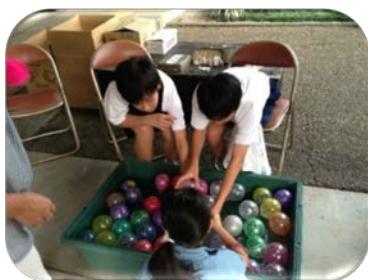
“太田宿中山道会館”での様子